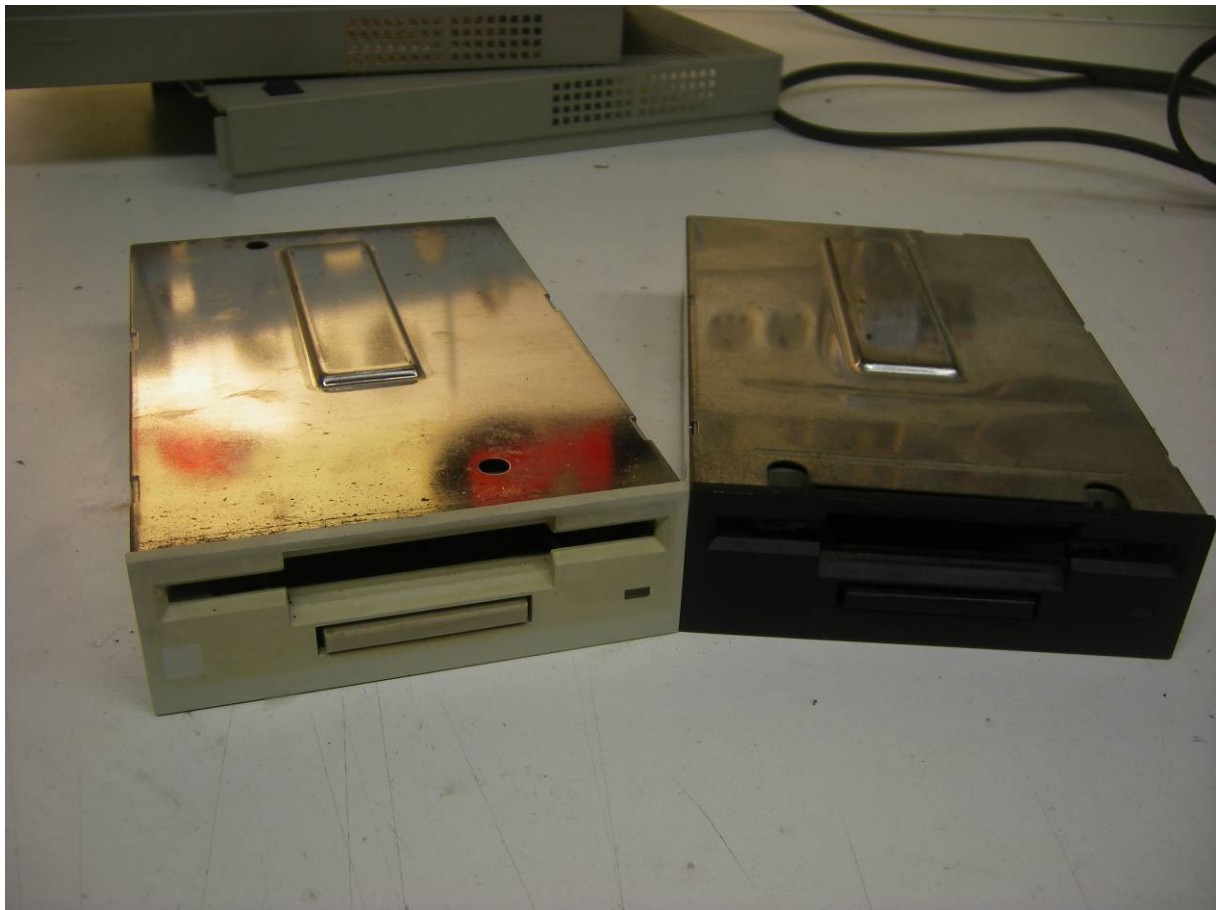
2 voorbeelden van dubbelzijdige diskdrives

Het reviseren is natuurlijk alleen van toepassing op diskdrives welke normaal werken en dus niet defect zijn. Door deze kleine aanpassing kan de levensduur van de diskdrive verlengt worden.