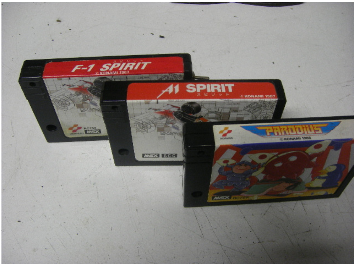
Enkele Konami SCC-cartridges

Solid Snake, Nemesis 3 en Koreaanse SCC-cartridges kunnen wel schakelbaar gemaakt worden, maar volgens een ander schema.