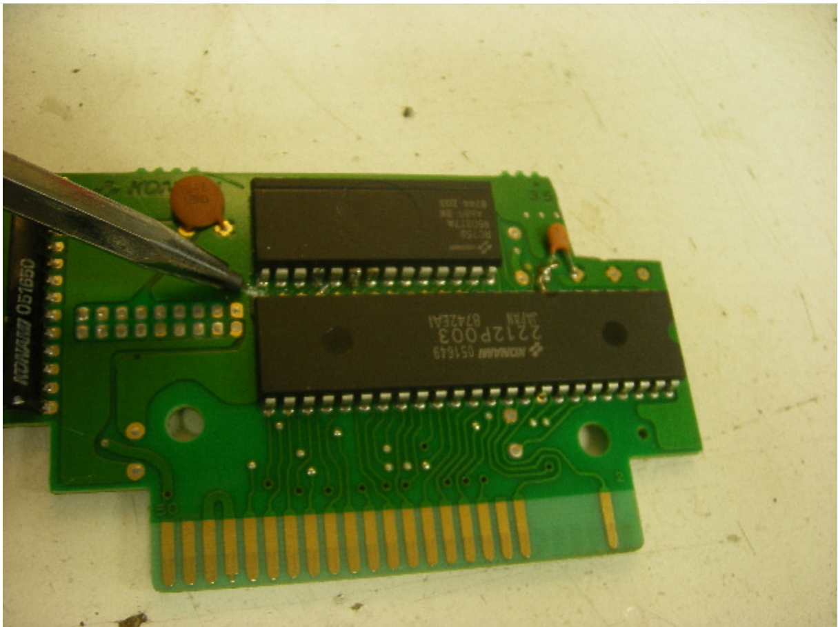
Het doorkrassen van het printspoor